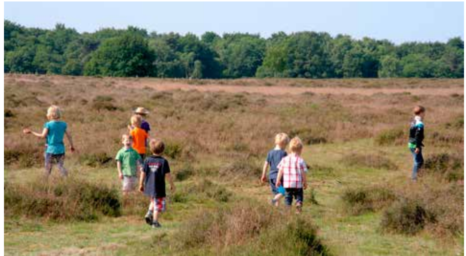
De commissie Wervende gemeente in Ommen organiseert deze zomer Bijbelspeurtochten voor kinderen.

De NGK Ede (Proosdijkerk) biedt tot aan de zomervakantie een vervolg aan op de catechisaties. De catechisanten kunnen meedoen aan zogenaamde tracks . Dat zijn workshops waarin het geloof wordt verdiept en die ongeveer anderhalf uur duren. Er zijn diverse mogelijkheden: een