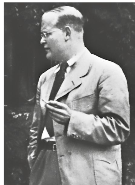
Bonhoeffer kiest er bewust voor om Gods wetten te gehoorzamen boven die van het naziregime.

Naast deze speelfilm zijn er ook diverse documentaires gemaakt over het leven van Bonhoeffer. Memoires and perspectives uit 2014 (zwart-wit) vertelt het verhaal van het verzet tegen de nazi's voor en tijdens de Tweede Wereldoorlog. Door de interviews met familieleden en vrienden van Bonhoeffer en het vele historische beeldmateriaal komt het verhaal van deze Duitse verzetsheld heel dichtbij. Hanged on a twisted cross , eveneens uit 2014, geeft door middel van zelden eerder vertoond archiefmateriaal, waardevolle documenten en bezoeken aan de originele locaties, een inkijk in het leven en het gedachtegoed van Bonhoeffer. De dvd's zijn afzonderlijk verkrijgbaar, maar voor een zacht prijsje ook als set van drie, bijvoorbeeld via www.gospel.nl .