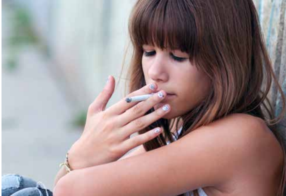
Het gevoel van onrecht kan zich uiten in destructief gedrag. Bijvoorbeeld door nagelbijten, roken, drinken, eetgedrag, drugs, automutilatie.