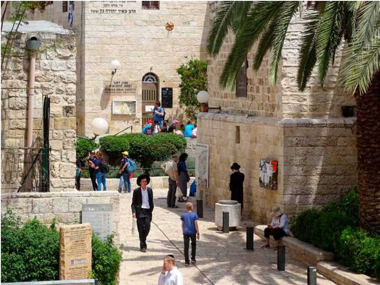
Jood en niet-Jood in Jeruzalem: de openheid en het contact tussen beiden groeit.

Jeruzalem, een aanstelling die dit najaar ten einde loopt.