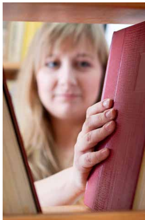
Kennelijk weten vrouwen in Efeze te weinig van de Bijbel en moet hun kennis worden bijgespijkerd.

Wat zegt dit nu over vrouwelijke ambtsdragers? Gaat het hier wel over ambtsdragers? Onderwijs geven kan horen bij mensen met functies (Efeziërs 4:11), maar hoort ook bij de gaven aan mensen in de gemeente (Romeinen 12:7, Kolossenzen 3:16). Gezag zit niet specifiek vast aan een ambt (Kolossenzen 3:16-17). 1 Timoteüs 2 is er niet helder over. Maar als je deze woorden