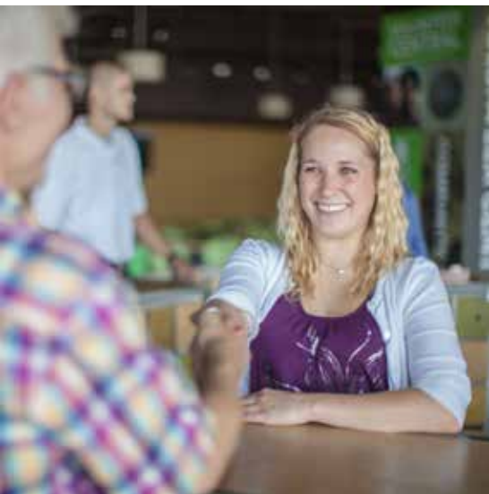
Het eerste contact wordt door de buddy gelegd.

Wat is precies een buddy? De jeugdouders: 'De jongeren krijgen een contactadres waar ze terecht kunnen om bijvoorbeeld een keer mee te eten of een biertje/kop koffie te drinken. Maar ook om een gesprek te voeren en misschien wel samen te bidden. De jongeren vinden er een luisterend oor en kunnen zo geholpen worden met hun rol in de gemeente of met ontwikkelingen/blokkades in hun leven.' Het eerste contact wordt door de buddy gelegd. Ook moeten de buddy's alert zijn op eventuele problemen en hierover in overleg gaan met de jeugdouders of de interne vertrouwenspersonen. Op die manier kan er een netwerk ontstaan voor jongeren, naast het gezin en de familie en kan er meer verbinding groeien tussen jong en oud.