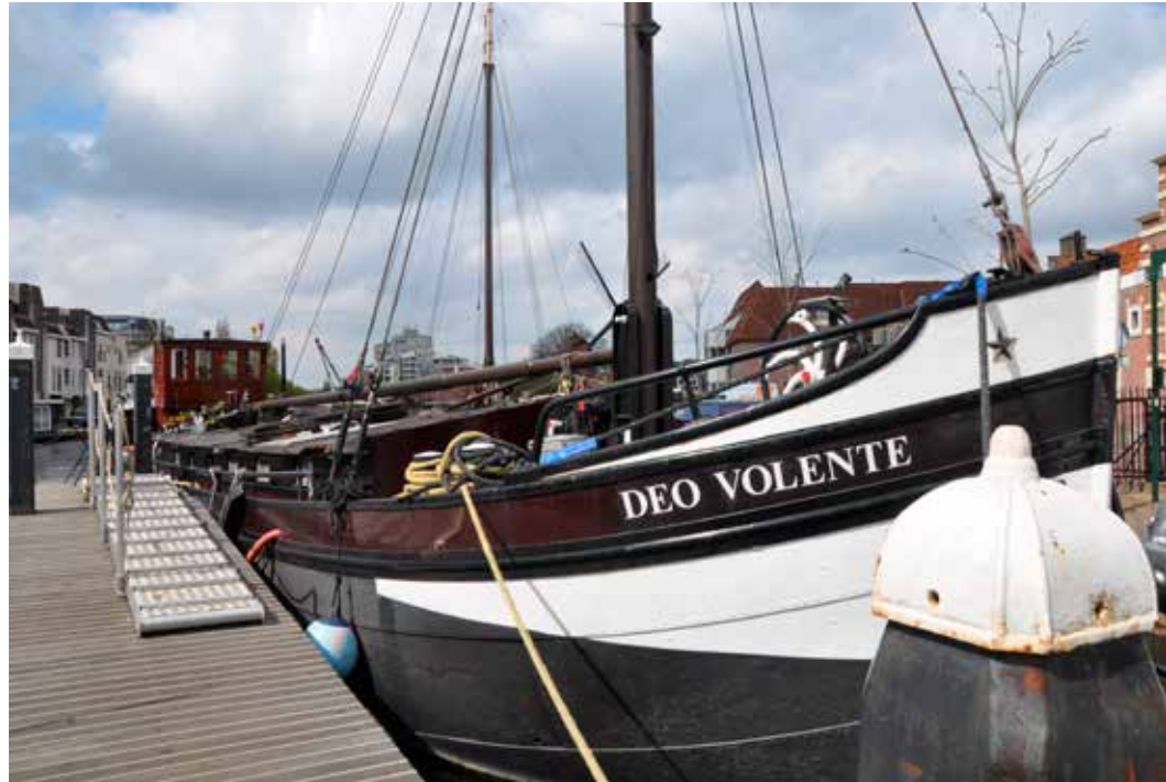
Misschien beseffen juist schippers hun afhankelijkheid, aangezien ze leven in weer, wind en water.

Toch gaat het christelijke Deo volente nog iets dieper dan alleen bescheidenheid tegenover de Almachtige. Opmerkelijk genoeg blijven de toekomstplannen in de formulering die