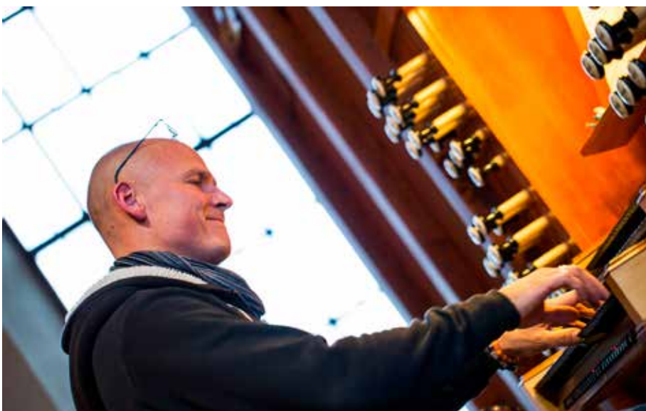
En tussen alles door speelt de organist of pianist, maar die wordt soms amper gehoord.

Wat delen de NGK/CGK van Hengelo en de CGKv van Nijmegen? In ieder geval dat ze allebei de zogenaamde mededelingen voor de dienst opgeschoond hebben. Daarvoor zijn tegenwoordig andere middelen meer geschikt: de beamer en (in Nijmegen) de wekelijkse digitale nieuwsbrief. Het nut van de soms uitgebreide lijst mededelingen aan het begin van de dienst wordt betwijfeld: er komt (te) veel informatie in (te) weinig tijd op mensen af en het komt niet altijd tot zijn recht in de drukte voor de kerkdienst. In Nijmegen vindt men het soms zakelijke karakter van de mededelingen ook niet op het niveau van de kerkdienst staan. Voor beide gemeenten is dat een belang-