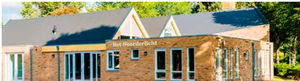
Het Noorderlicht is het kerkgebouw van de GKv Assen-Peelo.

Niet alleen evangelische, ook gevestigde kerken komen ermee in aanraking: mensen die pas als volwassene God leren kennen en daarom de doop aanvragen. Daar gaat vaak een traject van catechese aan vooraf dat al snel een paar jaar in beslag neemt. En aan het einde volgt, net als bij de 'gewone' catechisanten, een gesprek met de kerkenraad. Maar wat als zo iemand al veel eerder zeker weet dat hij of zij bij God wil horen, maar in kennis nog niet zover is? De kerkenraad van Assen-Peelo (GKv) heeft daarover nagedacht en kwam met een oplossing: doe dan gewoon twee keer belijdenis. De eerste keer als het voor de toetreders duidelijk is dat hij of zij echt bij de gemeente en bij God wil horen, en een tweede keer op een later moment, bij het afronden van het hele traject. De kerkenraad heeft zich daarbij laten leiden door de geschiedenis van de eunuch uit Ethiopië uit Handelingen 8. Daarbij spelen