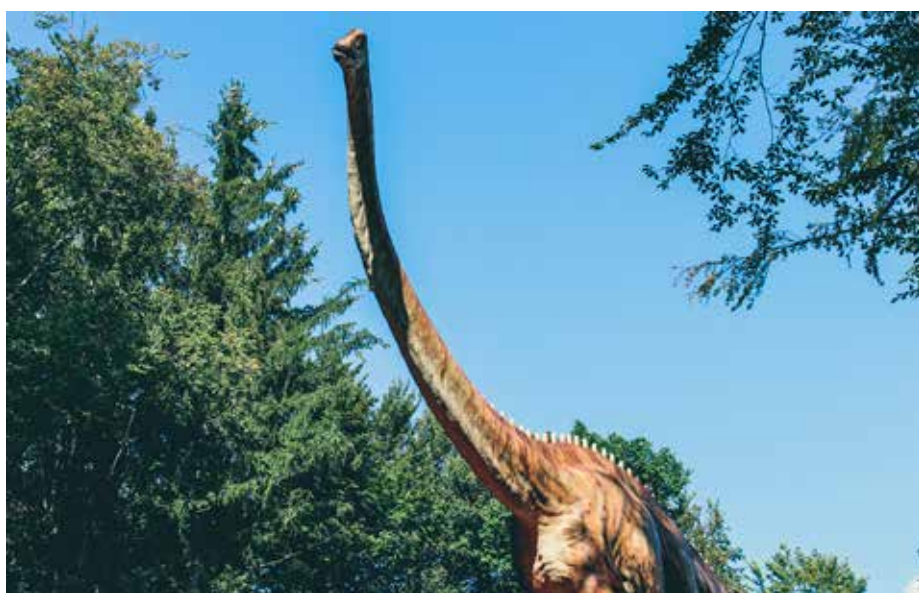
Verder leven er vragen over het ontstaan van de Bijbel, over dinosaurussen, en over allerlei actuele onderwerpen.