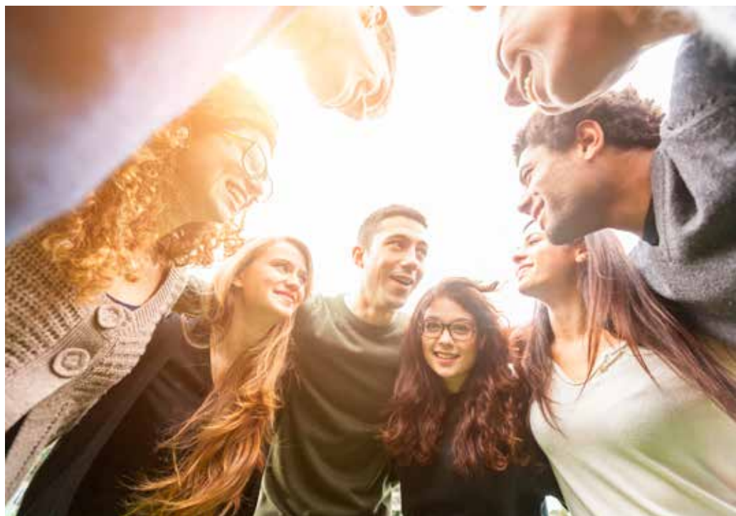
Individuele gevoelens worden collectief intens beleefd.

boven een eigen auto. Dit raakt aan de vorige trend, de intensivering, omdat het met name om de beleving gaat. Daarnaast doen de mooie foto's het ook goed op sociale media. Volgens ons speelt er nog een andere factor mee, namelijk de zoektocht naar schoonheid, rust en hoop. Dit kan gezien worden als een vlucht, weg van de prestatiedruk, en tegelijk als een poging om betekenis te geven aan hun leven.