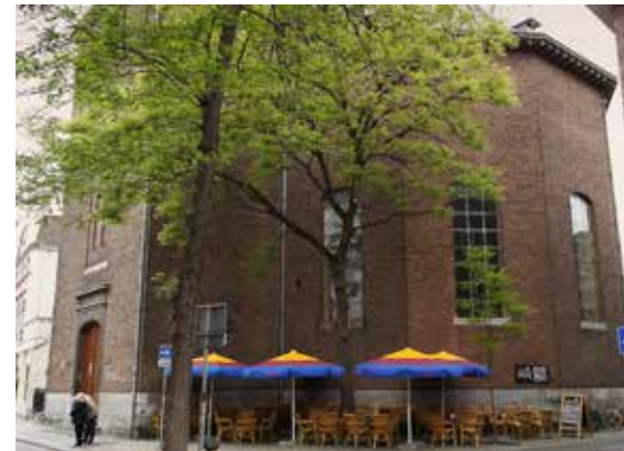
In de Waalse Kerk (GKv-NGK Maastricht) komt ook een peuterspeelzaal.

De Open Hof (NGK Dordrecht) is al veel verder met het gedeelde gebruik van het gebouw. Naast een intensief gebruik door de eigen gemeente op zondag en door de week, vinden er ook diensten plaats van de Vietnamese Protestantse Gemeente. Maar er worden ook vioollessen gegeven en EHBO-cursussen, waarbij waarheidsgetrouw geschminkte mensen met hun 'wonden' rondlopen, en de voedselbank gebruikt het gebouw als uitgiftepunt. Daarnaast zijn er verenigingen uit de buurt die het gebouw gebruiken voor hun vergaderingen: twee verenigingen van appartementseigenaren en een moestuinvereniging. Ook wordt de kerk benut als uitgiftepunt voor kranten. De Open Hof heeft verder buurtwerk opgezet in de wijk Sterrenburg, met onder meer elke laatste zaterdag van de maand een buurtmiddag met creatieve activiteiten. Elke dinsdag is er een inloopmiddag, met onder meer taalondersteuning, een creahoek, een bidhoek, verkoop van tweedehandskleding en een beweegtuurtje.