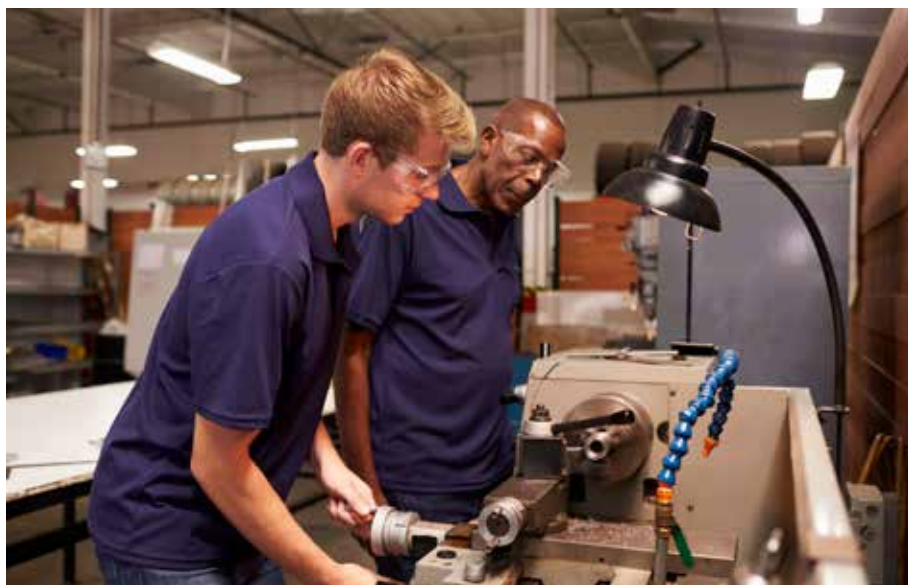
Een 17-jarige mbo-leerling, die werkt en daarbij een inkomen verdient, leeft in een volwassen wereld. Vergeleken daarmee leeft een 17-jarige vwo-5-leerling nog in een schoolwereld.

In de Jeugdtrends 2017 beschrijven we ontwikkelingen die we bij alle jongeren her-