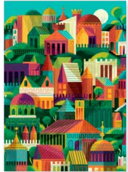
Eén van de illustraties van Don Clark.

gaan: wat of wie zie je hier en wat gebeurt er? Ouders of leerkrachten worden zo uitgedaagd om behalve voor te lezen ook te vertellen. De tekst van de kinderbijbel beschrijft de geschiedenis van God en mensen, in de woorden van de ondertitel: hoe de slangendoder ons terugbrengt naar de tuin. Het lijkt me een kinderbijbel die in gezinnen, op school en op de kinderclub veel gespreksstof kan opleveren en die prima ter afwisseling van de gangbare kinderbijbels gebruikt of cadeau gedaan kan worden.