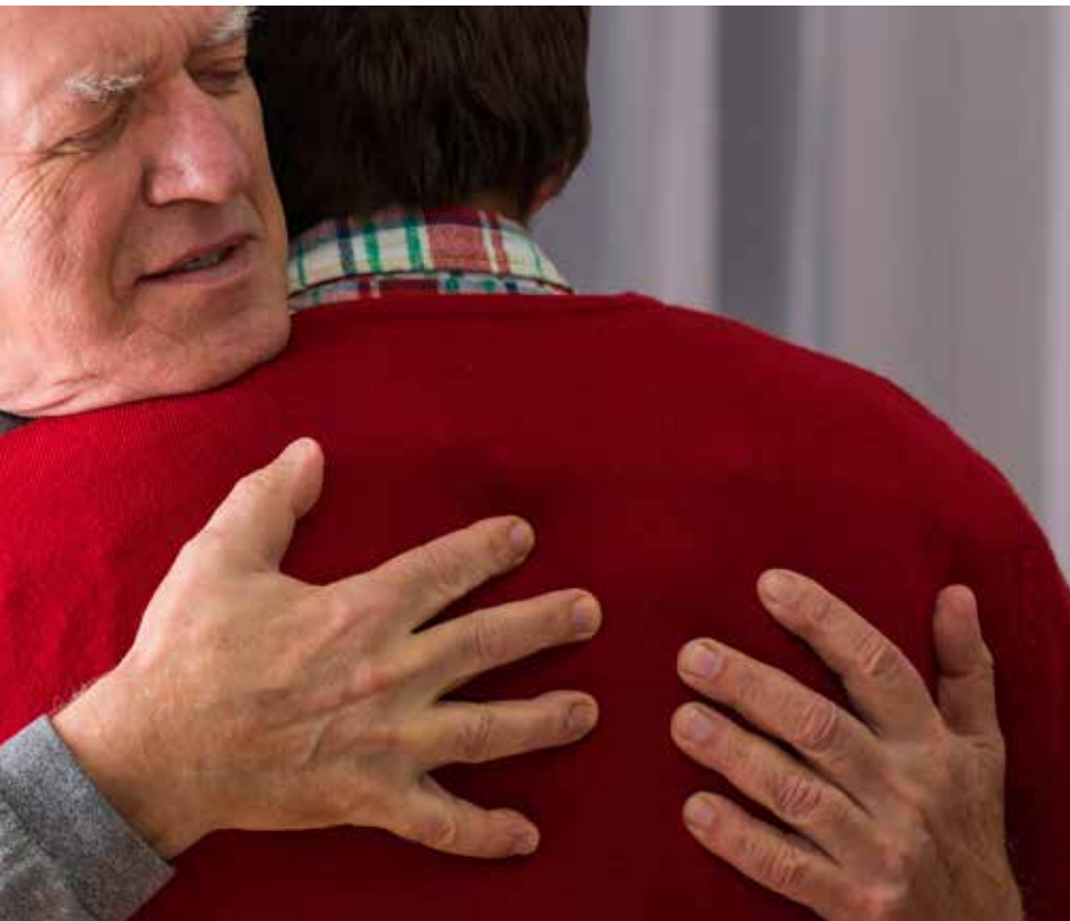
Je hoort het vaak, bijvoorbeeld in ouderdom: het is moeilijk, maar er is veel om dankbaar voor te zijn.

>> Dankbaar zijn is één ding; danken is wat anders. Dankbaarheid is wat je voelt. Danken is wat je doet.