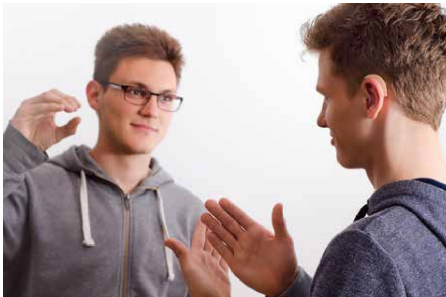
Doven hebben – net als horende mensen – contact en aandacht nodig, en vinden het al geweldig als mensen proberen contact te maken, via briefjes of een paar gebaren.

>> ‘Jezus zoekt niet eerst de mooiboy, de geslaagden’ <<