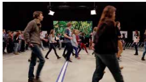
De gespreksleider stelt een vraag en de jongeren op wie die vraag van toepassing is, stappen over de streep.

Het werkte goed in Nieuwleusen: er werd heel wat over de streep gestapt. Daarna gingen de gemeenteleden in groepjes met elkaar in gesprek. Er waren stellingen en vragen beschikbaar, 'maar in de meeste groepjes deed "Over de streep" al zo veel