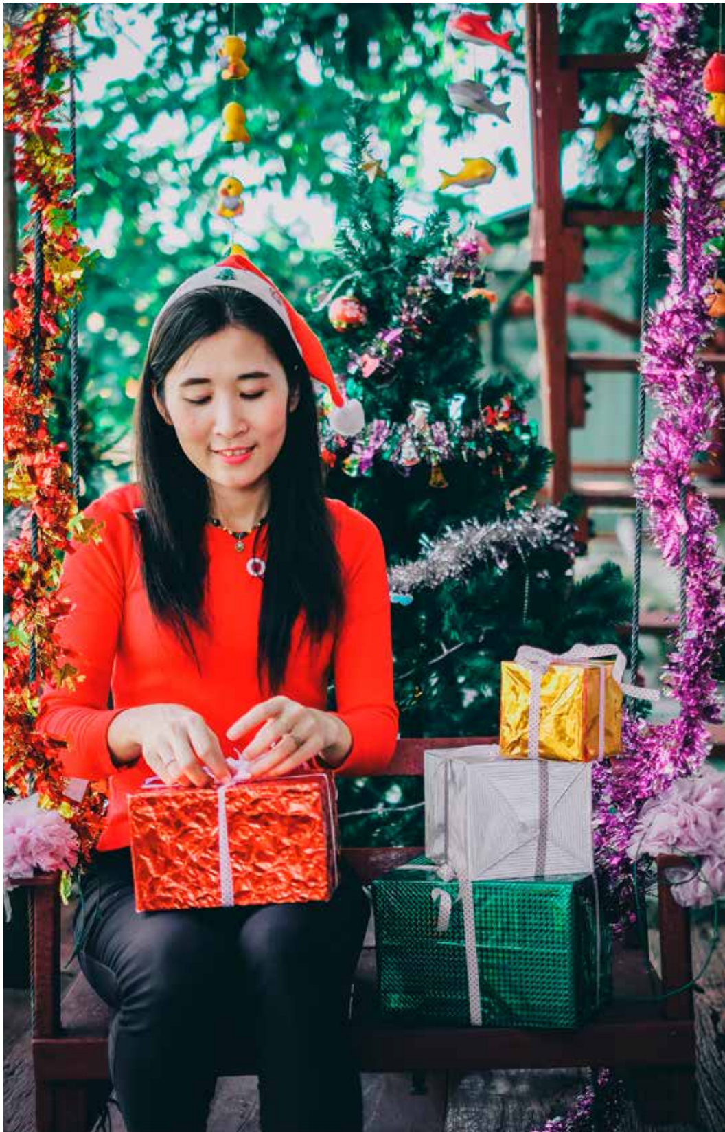
Batakse christenen zijn dol op kerstversieringen. Hoe kitscheriger hoe beter.

Het lijkt erop dat kerst overal ter wereld het feest van overvloed is. Je versiert je huis met een smaakvol kerststuk of met knipperende glitters, al naar gelang je cultuur, en je zorgt voor extra lekker eten. Gevulde kalkoen voor de Engelsen, pittig varkensvlees gemengd met bloed voor de Batak. Zelfs in de kerk zijn er extra's. Ik herinner me de trompetten die één keer per jaar waren toegestaan om naast het orgel extra luister te verlenen aan de kerkdienst. Een voordeel van mijn ervaringen met kerst in zowel de westerse als de Aziatische cultuur is dat ik weer op zoek ben gegaan naar de basis. Kerst, wat was dat ook alweer? We vieren dat Christus zonder verwijt de hemelse heerlijkheid achter zich liet om mens te worden. Daar was niet veel westers of Aziatisch aan. Het was allereerst ontluisterend. Hij kwam in de nederige kribbe in Betlehem. En zelfs als Hij in een luxe privékliniek geboren zou zijn: de vertrouwde aanwezigheid van de Vader wisselde Hij in voor een leven onder de vloek van de zonde. >>