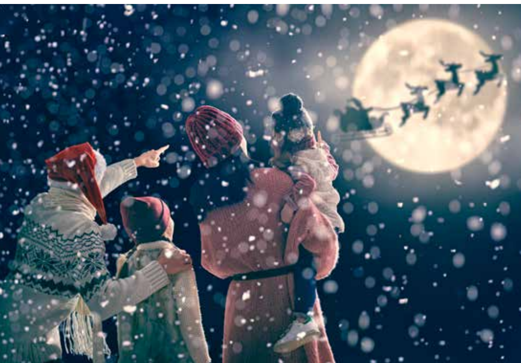
Zijn we ooit in staat geweest om de heidense elementen van kerst uit te bannen?

Hoe kun je dat als christen passend vieren?