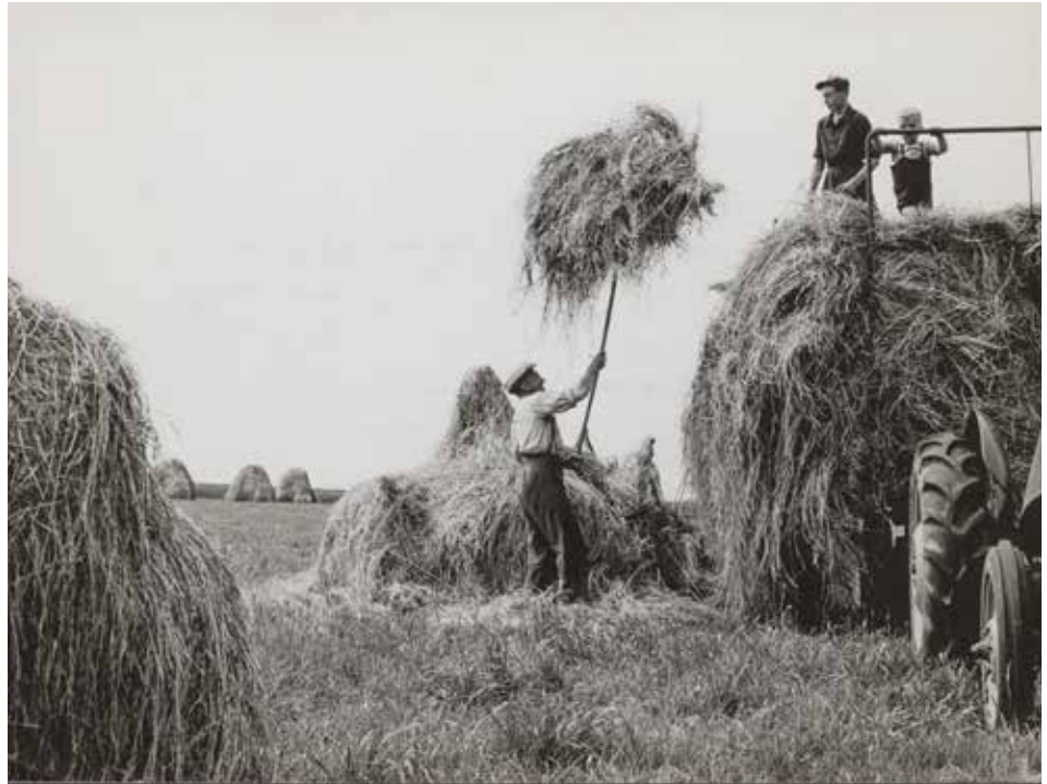
Als oudere gemeenteleden hun levensverhaal vertellen, levert dat vaak prachtige oral history op, bijvoorbeeld over het harde leven op het platteland.

al kan, hoef je niet meer naar de les te komen." Ook het leven met God is blijven leren en je hebt geduld nodig bij je eigen falen, maar ook bij dat van een ander.' Een ander schrijft over deze vrucht van de Geest: 'Tja, dat gen hè, en mijn karakter. Daar mankeert nog wel het één en ander aan.' In de reacties op het geloof als vrucht van de Geest zit meer overeenstemming. 'Het geloof is geloven dat wat iemand tweeduizend jaar geleden heeft beloofd, waar is', zegt de één. Dat doet denken vraag en antwoord 22 uit de Heidelbergse Catechismus. Een ander verwijst naar diezelfde Catechismus, die ze als jong meisje op catechisatie uit het hoofd moest leren: 'Veel ben ik vergeten, maar niet vraag en antwoord 21. Het is een prachtig stukje, samengesteld uit teksten uit de Bijbel. Het gaat over de Vader, de Zoon en de heilige Geest en bevat de kern van het evangelie.' 'Lees het maar na', voegt ze eraan toe.