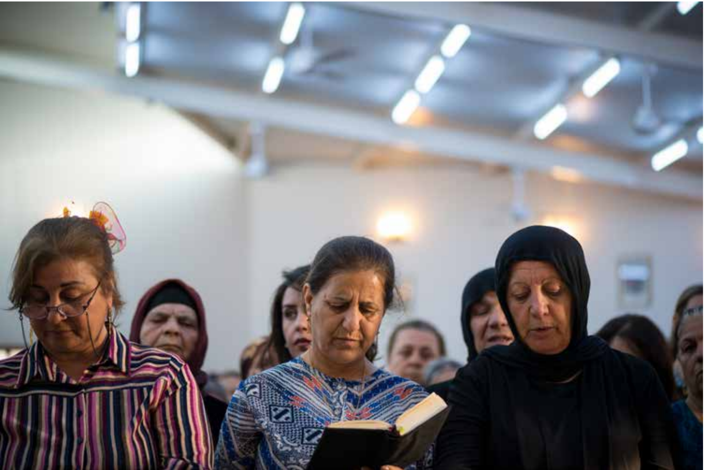
Een kerkdienst in het Iraakse Erbil. De meeste leden zijn een paar jaar geleden uit een ander deel van Irak gevlucht vanwege het IS-offensief.