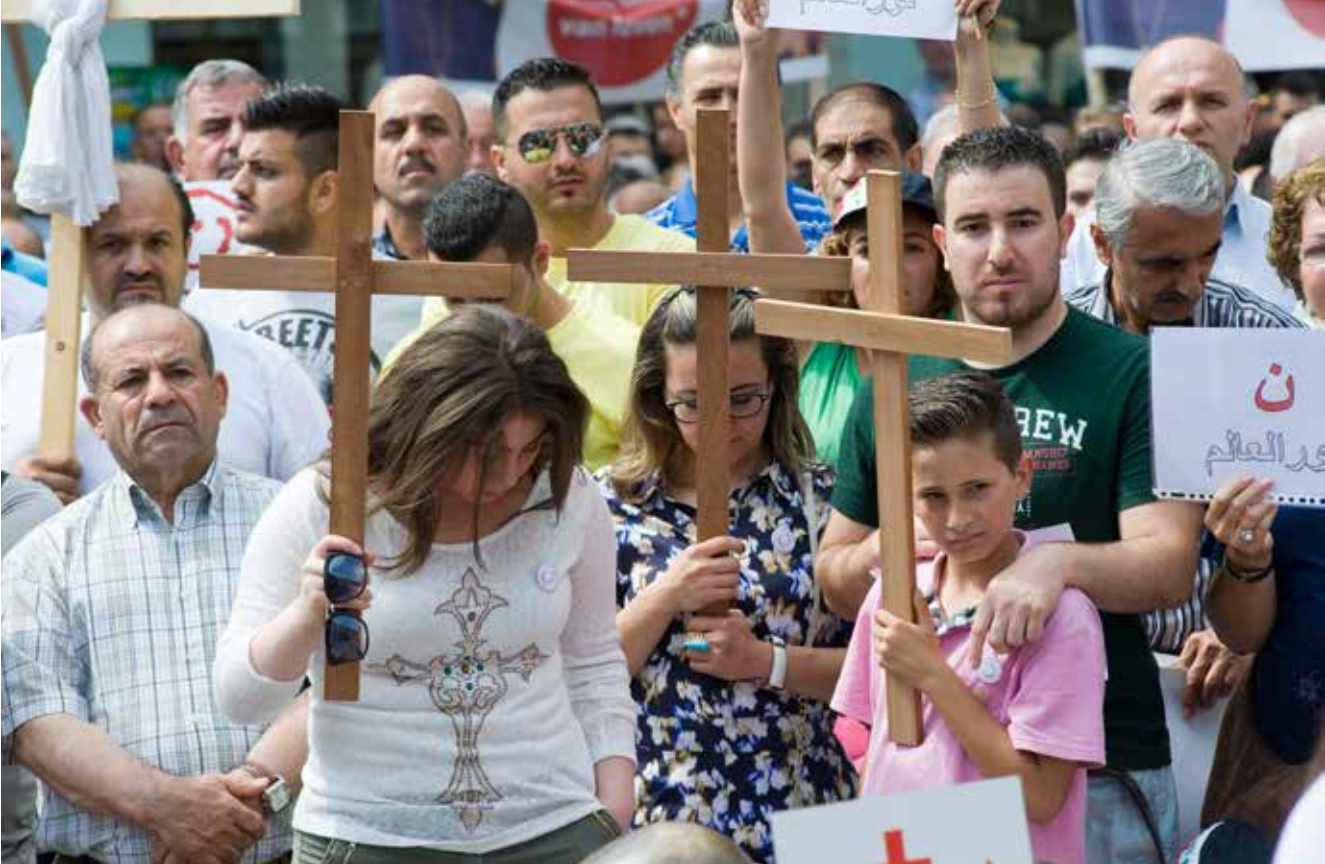
Christenen uit Syrië die in Nederland protesteren tegen de vervolging van christenen in het Midden-Oosten houden een minuut stilte.

aangewakkerd door de maatregelen van IS. Voldoende reden dus om Iraakse christenen asiel te verlenen in Europa.