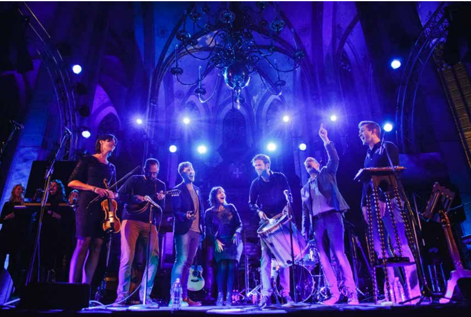
James MacMillan: 'Soms voel ik gewoon dat er een soort eenheid ontstaat tijdens het spelen, ook tussen de mensen in de zaal of kerk.'

leven. Bovendien vormt het evangelie bij Keller altijd het emotionele hoogtepunt van zijn verhaal, niet een sausje op het eind. In elk Bijbelverhaal zit een probleem, namelijk zonde, en Jezus is het antwoord op de zonde – zo preekt hij. Vervolgens is het antwoord nooit: go do better . Keller stuurt je nooit met het probleem naar huis om het vervolgens zelf maar uit te zoeken. Jij bent niet het antwoord, Jezus is het antwoord.