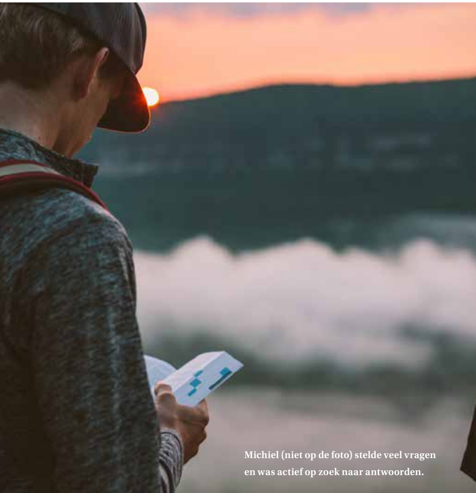
Michiel (niet op de foto) stelde veel vragen en was actief op zoek naar antwoorden.