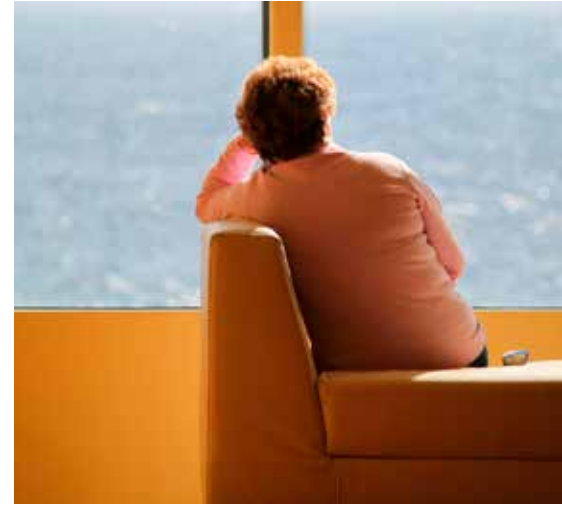
Het is niet gemakkelijk om anderen zich bewust te laten worden van de eenzame situatie waarin sommige mensen leven.

daaraan: 'We worden 24/7 geconfronteerd met een wereld waar we graag onderdeel van uit willen maken, maar het niet zijn.' Uiteraard zien hulpverleningsorganisaties hierin een taak, maar ze merken dat het niet gemakkelijk is om de inwoners van Wezep en Hattermerbroek zich bewust te laten worden van de eenzame situatie waarin sommige mensen leven. De kerken hebben in deze plaatsen op de Veluwe een enorm bereik en kunnen juist op dat punt van bewustwording veel betekenen. Concreet komt dat naar voren in de week van de eenzaamheid, van 25 september tot 2 oktober. Op 29 september is er een toerustingsavond in het GkV-kerkgebouw Noorderlicht, waar workshops zijn te volgen die worden aangeboden door de diverse hulpverleningsorganisaties.