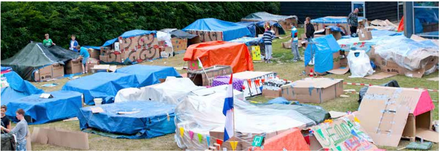
De Nacht Zonder Dak is een activiteit van stichting TEAR, waarbij jongeren een nacht in zelfgemaakt hutjes van karton en plasticfolie slapen. (beeld Nacht Zonder Dak)