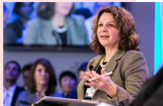
Minister Schippers meent dat de Nederlandse cultuur beter is dan alle andere die ze kent.

Een goede gewoonte uit Zuid-Afrika zou Harink bijvoorbeeld graag willen aanbevelen voor onze kerkelijke vergaderingen: zet aan het eind van de