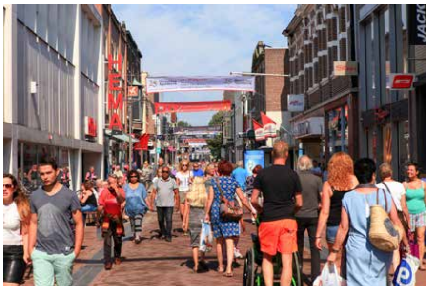
'We staan midden in onze maatschappij. En tegelijk zijn we anders. We zijn burgers van een hemels koninkrijk.'

Het thema zelf was al voor de vakantie vastgesteld: vreemdelingschap. De kerkenraad: 'We hebben voor dit thema gekozen omdat we merken dat een christelijke manier van leven in onze maatschappij steeds minder vanzelfsprekend is.' Dat blijkt uit de ook in Ommen toenemende ontkerkelijking, uit de aanwezigheid van andere godsdiensten. Ook in Ommen is inmiddels sprake van de openstelling van winkels op zondag. De kerkenraad ziet een tendens om alle godsdienst uit het publieke leven te weren. Vandaar de actualiteit van het thema dat op verschillende manieren wordt uitgewerkt: 'Vreemdelingschap – dat betekent: we staan midden in onze maatschappij. We zijn met heel ons wezen daarmee verbonden. En tegelijk zijn we anders. We zijn burgers van een hemels koninkrijk.' Twee aspecten springen daarbij naar voren: leven uit de bron, de verbondenheid met Christus, én leven voor je bestemming, de nieuwe hemel en de nieuwe aarde. De gemeente krijgt als huiswerk mee om alvast na te denken over de vraag: hoe ervaar je zelf die vreemdelingschap?